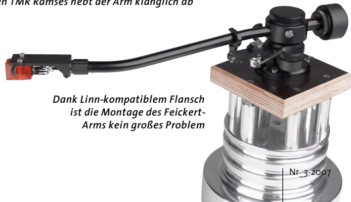
Dank Linn-kompatiblen Flansch ist die Montage des Feickert-Arms kein großes Problem

Tut es auch, denn seine dynamische, lebendige und ausgesprochen ausgewogene Spielweise bringt erinnert sofort an das, was wir auch von deutlich teureren „Führungskräften“ kennen, der DFA enthält sich in erfreulich hohem Maße einer tonalen „Meinung“. Der zum Vergleich herangezogene SM 309 spielt vordergründig etwas substanzieller, offenbart bei genauerem Hinhören aber auch seine kleine Vorliebe für den Oberbassbereich, die dem DFA 105 fremd ist. Zwar spannt der SME den Bogen ganz unten und ganz oben im Frequenzbereich noch etwas weiter, der Feickert wirkt innerhalb seiner Grenzen aber sehr stimmig und neutral. Sollte er bei seiner Gewichtsklasse nicht ein Kandidat für das Denon DL103 sein? Aber ja! Das „unsterbliche“ Denon mag den Schwarzwälder außerordentlich, weil das mitunter leicht bollerig-ungebremst tönende Denon hier merklich diszipliniert daher kommt und ungeahnten Feingeist freisetzt. Es vermag hier selten so zu beobachtende Raumtiefe darzustellen und staffelt sehr schön präzise. Das spricht alles schon recht deutlich für den DFA, doch da gibt's noch einen sehr empfehlenswerten Tuning-Tipp: Für nur 200 Euro Aufpreis liefert Christian Feickert den Arm mit dem Phonokabel Typ „Ramses“ des Berliner Herstellers TMR aus, und das kostet solo immerhin die Kleinigkeit von 650 Euro. Diese 200 Euro Auf-